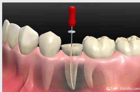
Wurzelbehandlung eines zerstörten Zahnes

Wurzelbehandlungen werden meistens mit Betäubung durchgeführt. Deshalb sind sie in aller Regel nicht schmerzhaft . In seltenen Fällen (wenn ein Zahnerv sehr stark entzündet ist), können trotz Betäubung während der Behandlung vorübergehend Schmerzen auftreten.